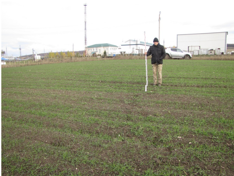
Рис. 4. Шурф № 1. Место заложения и район расположения проектируемого пункта приёма нефти, на распаханной водораздельной поверхности. Вид с запада.