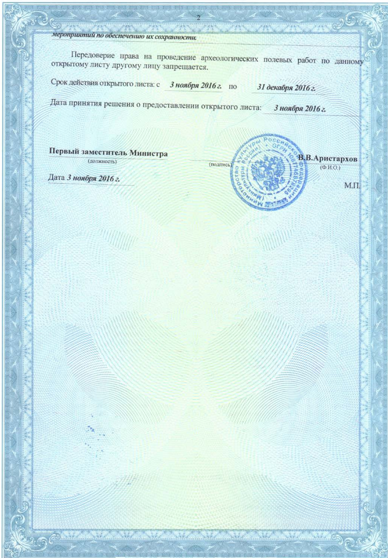
Рис. 7. Копия Открытого листа.