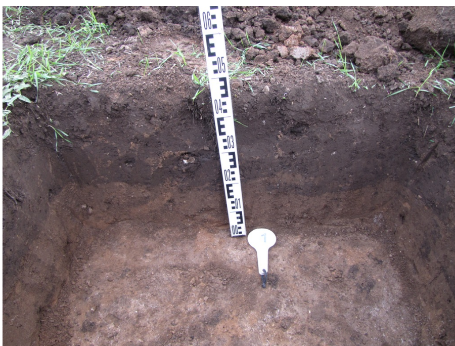
Рис. 5. Северная стенка шурфа №1.