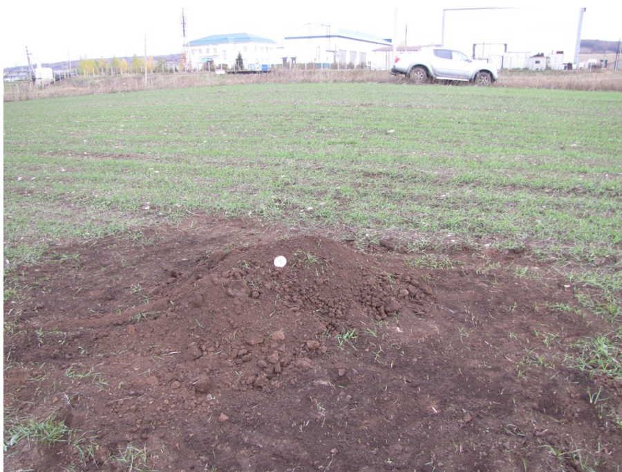
Рис. 6. Шурф №1 после рекультивации.