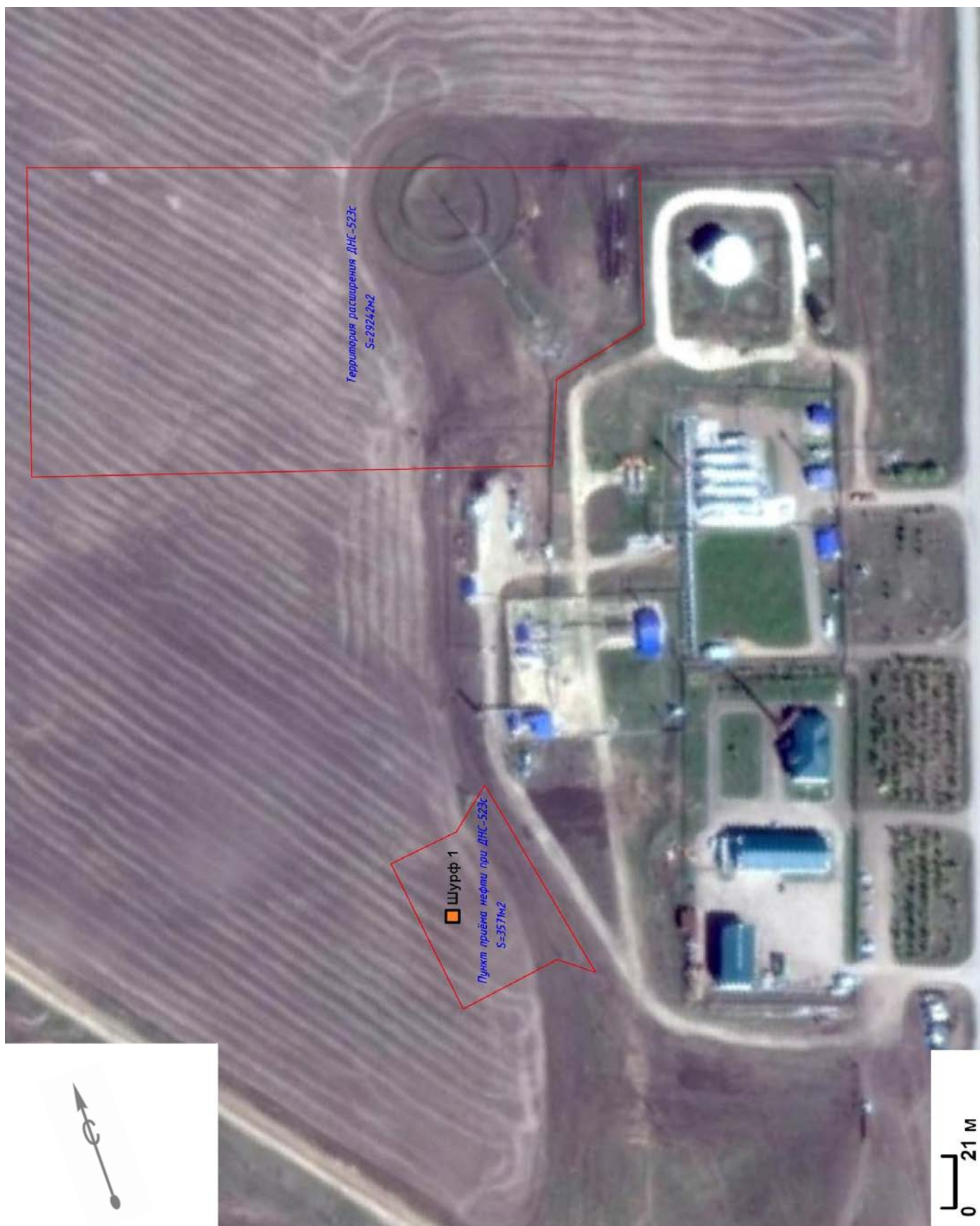
Рис. 3. Земельный участок проектируемого строительства и место расположения археологического шурфа.